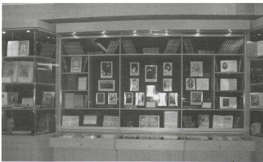
Елемент музейного комплексу Бібліотеки-філіала № 1 ім. К.В. Плеханової

Бібліотека с. Маго Хабаровського краю після смерті місцевого поета В. Єращенко почала збирати матеріали про земляка. З кола шанувальників, місцевої адміністрації, журналістів була сформована ініціативна група. В результаті