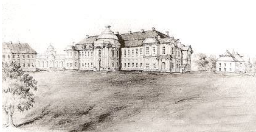
Палац Сангушків у Заславі (Ізяславі), 1872 р. Худ. Наполеон Орда

Відбір матеріалів завершено у квітні 2010 р.